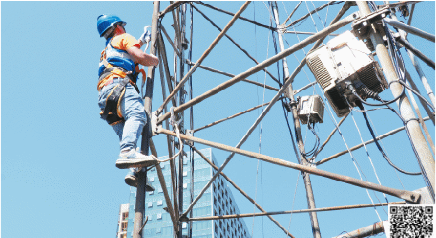
长沙移动5G建设人员正攀爬铁塔,以安装5G通信设备。

记者从长沙移动了解到,当天所建设的基站,只是该公司在6月至8月期间建设的534个5G站点之一。这些基站如同一张大网,将高速、稳定的5G信号送到长沙各地,为市民带来更加便捷、高效的通信体验。