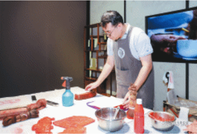
活动现场展示古籍修复技艺。

长沙晚报9月20日讯(全媒体记者 宁莎鸥 通讯员 邓青岚 胡婷 许志云)让80余万册珍贵典籍活起来!20日,“书百廿风华 传千年文脉——湖南图书馆古籍保护与活化利用成果展”在湖南图书馆启幕,本展是湖南图书馆建馆120周年之际推出的特展,旨在让大众重温动人的文献西迁的动人故事,体现了图书馆人千方百计搜古访旧,不遗余力守典护籍的担当;第二单元依托湖南图书馆特色馆藏,采用“实物展示+数字展项”相结合的方式,呈现湖南图书馆所藏珍贵古籍、名人字画、湘人手稿等;第三单元聚焦湖南图书馆古籍修复师如何与历史对话,与时间为友,让历经沧桑的古籍重新绽放光彩,让源远流长的中华文脉得以在泛黄的书页间延续;第四单元推陈出新打造沉浸式探秘湘图数字空间,尝试“古籍+科技”的融合,让“沉寂的文字”变成“鲜活的中国故事”,在跨越时空的对话中,实现文脉的传承交融。