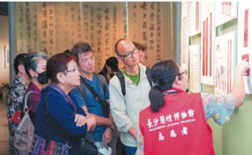
一位志愿者正在为观众讲解《承汉启唐——北朝书法与雕塑艺术展》展品。

文化供给,让历史文化在传承发展中滋养人民、光照人心。举办此次特展,是擦亮悠久历史文化名片的创新之策,是答好文化和科技融合命题的务实之举,也是迎接全市旅发大会的应时之作。