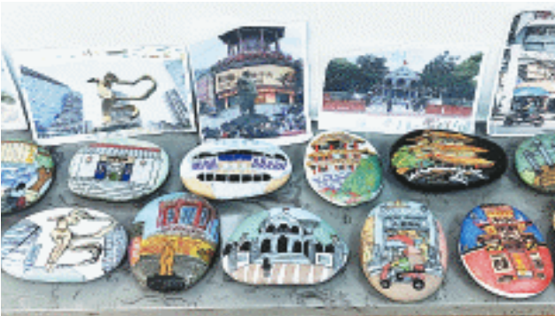
孩子们把秋天的长沙美景复刻到河边捡拾的天然石头上。

长沙晚报10月15日讯(全媒体记者 张炎炎 通讯员 滕璐祺) 河边捡起的石头,能玩出什么花样?14日,长沙市天心区沙湖桥小学孩子们以石头为画布,将长沙的16个标志性景点创作成了别具特色的长沙秋日美景。