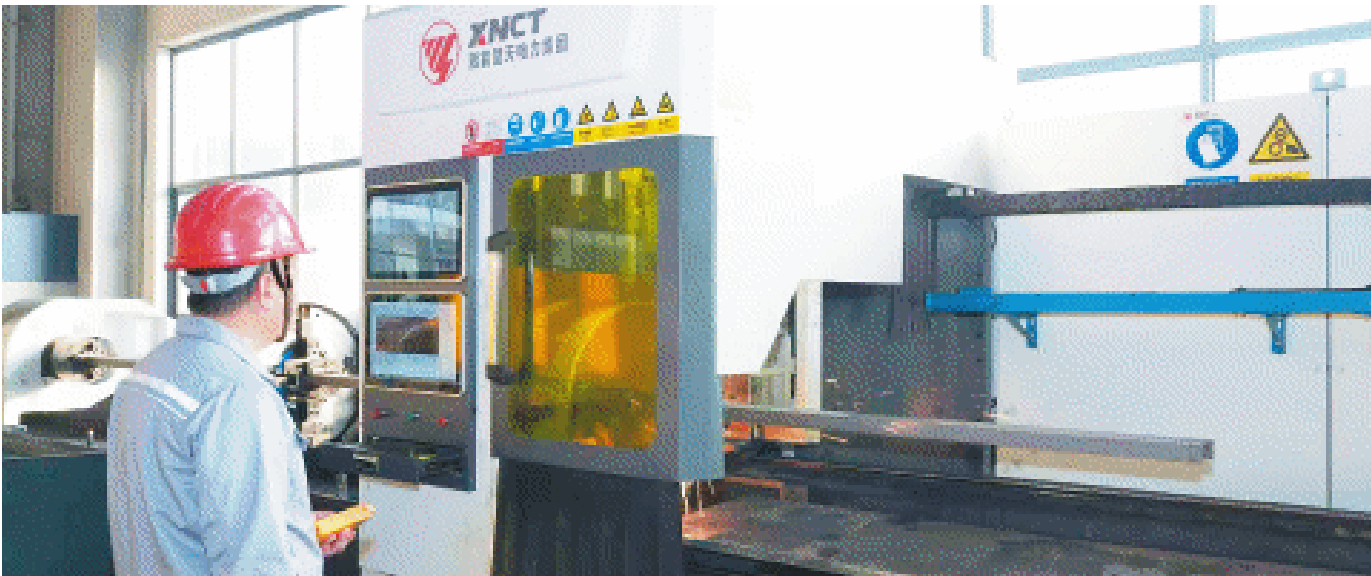
湘能楚天电力集团生产车间内,一线工人正在操纵智能化生产设备。