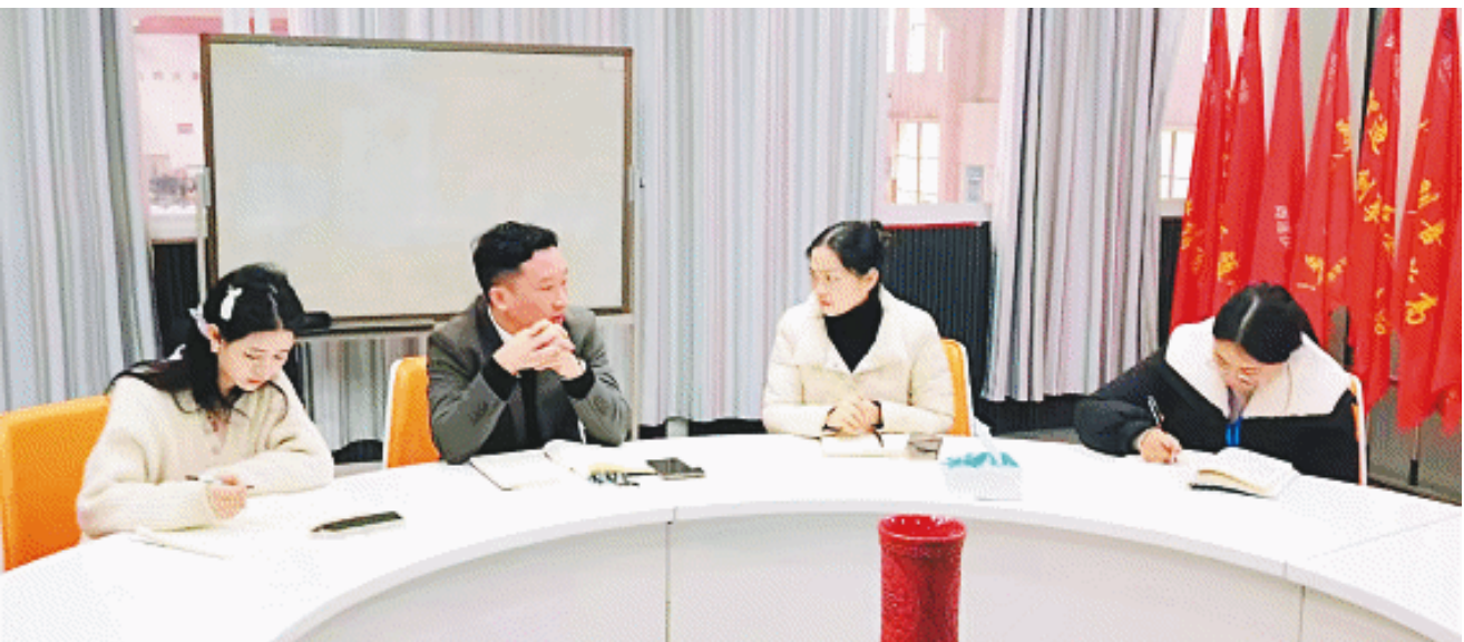
雨花经开区企业服务中心工作人员走访园区企业创研智能,了解企业需求。