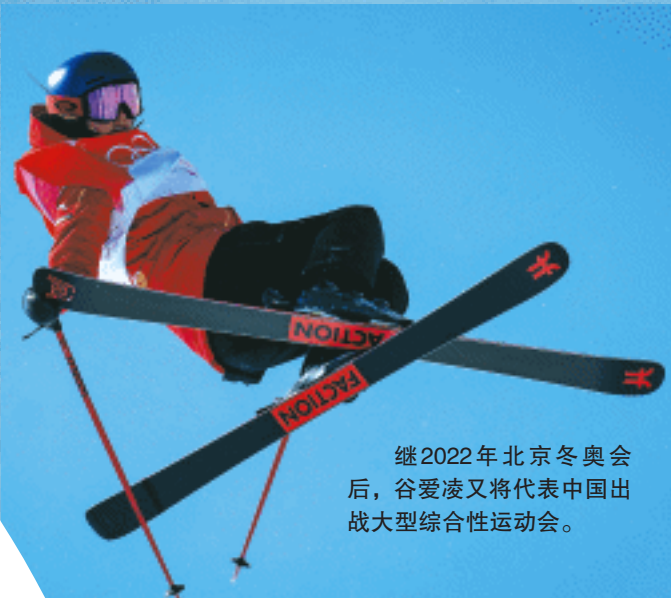
继2022年北京冬奥会后，谷爱凌又将代表中国出战大型综合性运动会。