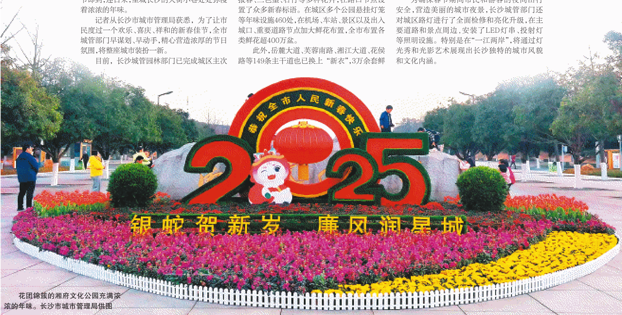
花团锦簇的湘府文化公园充满浓浓的年味。

为确保春节期间市民和游客的夜间出行安全,营造美丽的城市夜景,长沙城管部门还对城区路灯进行了全面检修和亮化升级,在主要道路和景点周边,安装了LED灯串、投射灯等照明设施。特别是在“两江两岸”,将通过灯光秀和光影艺术展现出长沙独特的城市风貌和文化内涵。