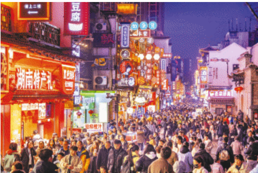
春节期间,天心阁、五一商圈两大地标形成了客流双向奔赴,不少游客在太平街、都正街买了国潮伴手礼带回家,又上天心阁遛弯。

长沙晚报2月3日讯(全媒体记者 宁莎鸥)春节期间,长沙历史文化地标天心阁以一场融合传统年俗与古城风韵的文旅盛宴,为市民和游客打造沉浸式新春体验。天心阁毗邻五一商圈,春节期间,两大地标也形成了客流双向奔赴,代表潮流的五一商圈与代表传统的天心阁古今互动,不少游客才逛黄兴路、又上天心阁,体验了琳琅满目的新春长沙玩法。