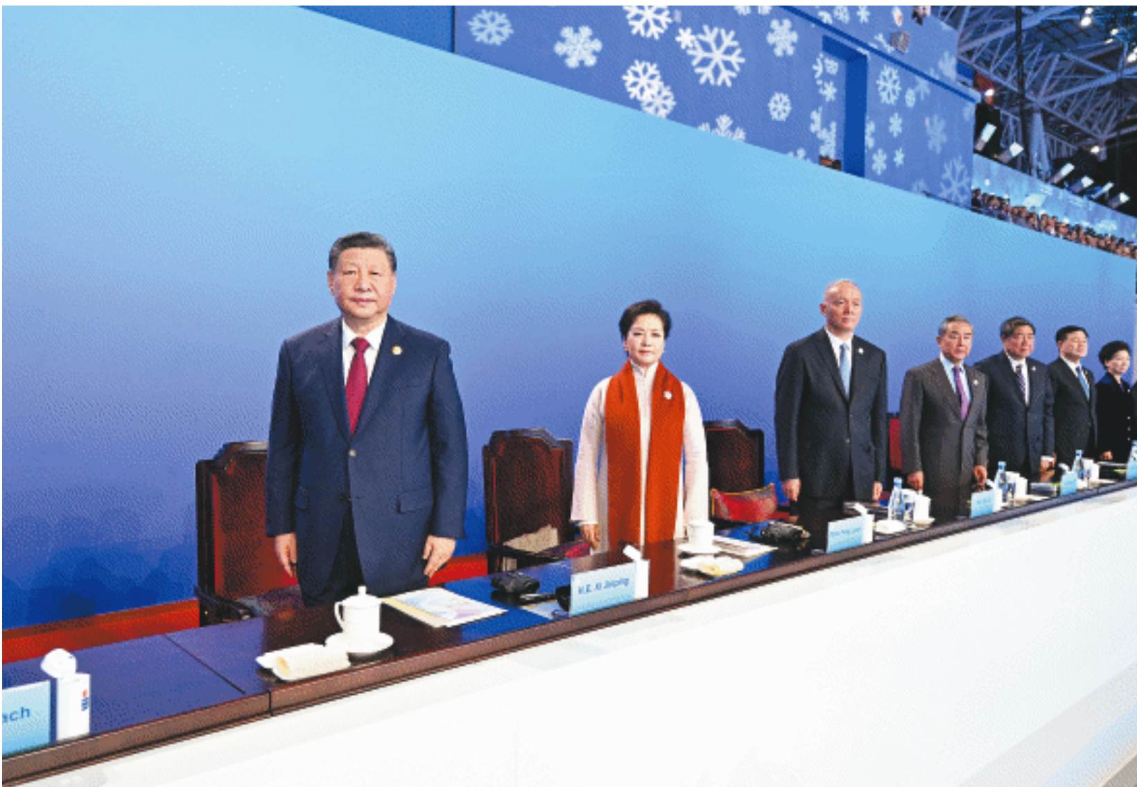
2月7日晚,第九届亚洲冬季运动会在黑龙江省哈尔滨市隆重开幕。习近平等党和国家领导人出席开幕式。

新华社哈尔滨2月7日电 冰雪同梦绽放光芒,亚洲同心共谱华章。第九届亚洲冬季运动会7日晚在黑龙江省哈尔滨市隆重开幕。国家主席习近平出席开幕式并宣布本届亚冬会开幕。 蔡奇、来自亚洲各地的领导人和贵宾等出席开幕式。 夜幕下,哈尔滨国际会展体育中心华