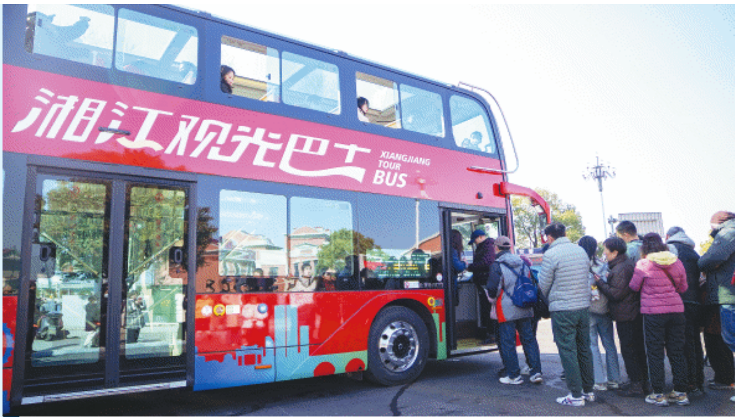
2月9日上午,由长沙城发文旅集团推出的湘江观光巴士正式亮相发车,开启试运营。长沙晚报全媒体记者 邓迪 摄

长沙晚报2月9日讯(全媒体记者 贾凯清) 2月9日上午,由长沙城发文旅集团推出的湘江观光巴士上线试运营,一辆辆红色的双层巴士伴随着明媚阳光从碧沙湖地铁站外出发,带着首批前来体验的市民和游客环游湘江。本次上线的湘江观光巴士体验如何?途经哪些站点?如何购票?记者搭乘首趟观光巴士进行了体验。