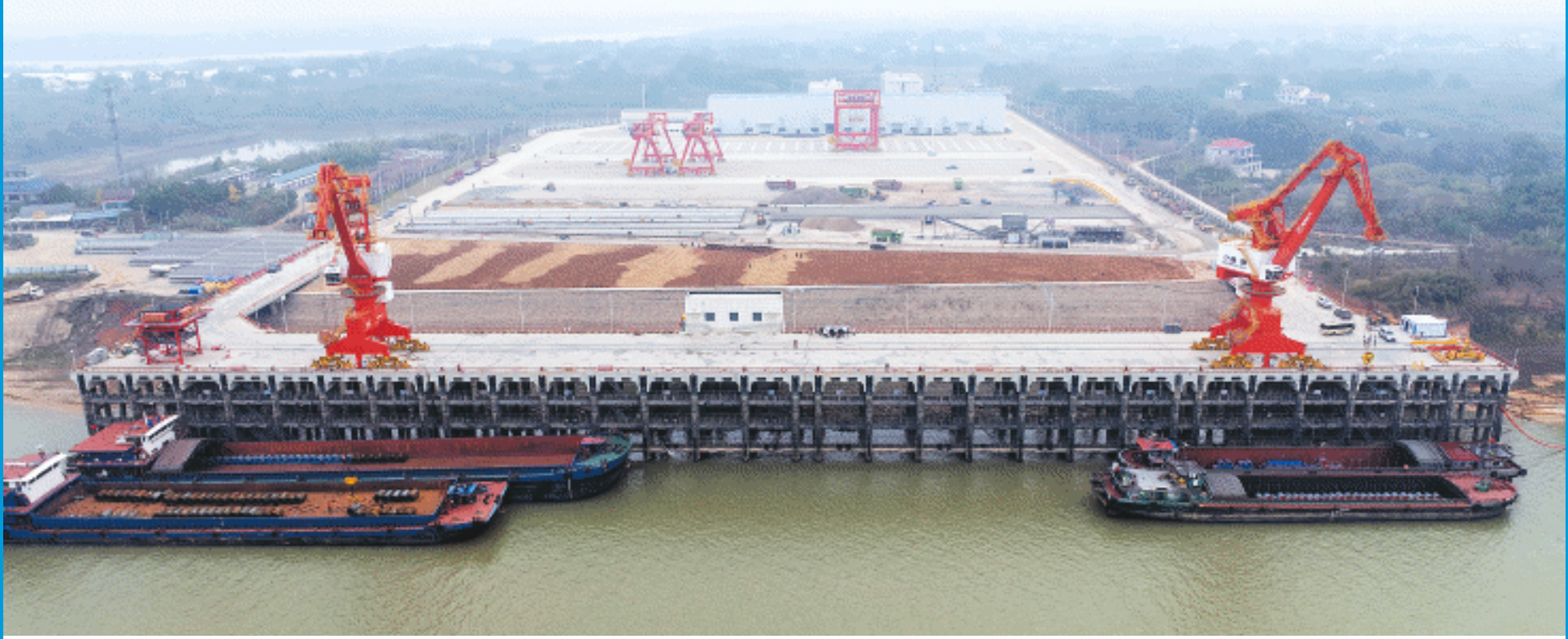
虞公港建成投运，将长江黄金水道向湖南内陆延伸近100公里，大幅缩短货物运输时间和运输距离，有效降低物流成本。

长沙晚报2月17日讯（全媒体记者 彭放）“钩子已挂好，可以起吊……”2月17日乍暖还寒，位于长沙临港产业开发区区内的虞公港码头却是一片热火朝天的景象。伴随着装卸工作人员通过对讲机传来的声音，大型港口起重机操作员随即将沉重的钢材吊装上岸。