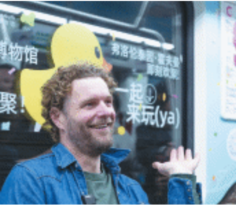
霍夫曼乘坐地铁专列。

弗洛伦泰因·霍夫曼最著名的作品“大黄鸭”(Rubber Duck)是在艺术家童年时代起就风靡已久的“小黄鸭”玩具的放大版,先后在全球20多处巡展,成为迄今为止世界上最知名的概念艺术作品之一。