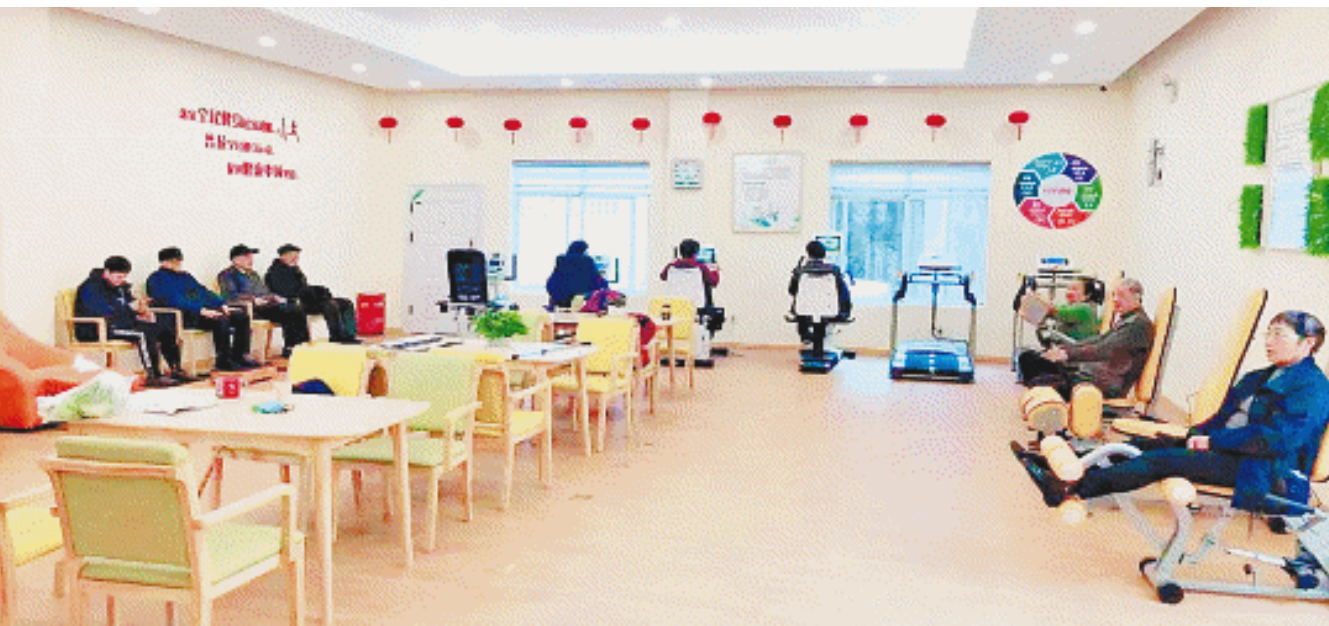
图为金科园社区老年活动中心。