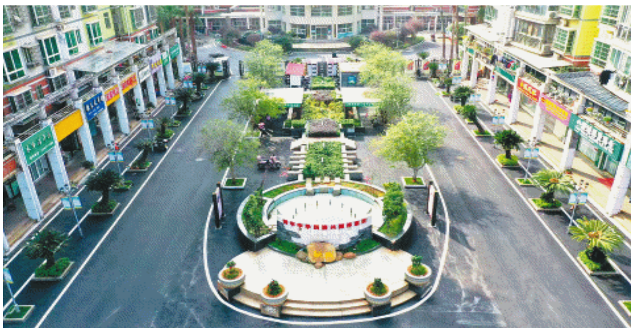
联诚花园小区焕然一新。

据了解,2024年6月以来,长沙市民政局组建专班,着重发力做好街面露宿、拾荒流浪乞讨人员救助管理工作,救助劝导对象3000余人次,协调公安部门、公益组织和外地民政部门查明身份并帮助返乡118人次,送医救治52人次。