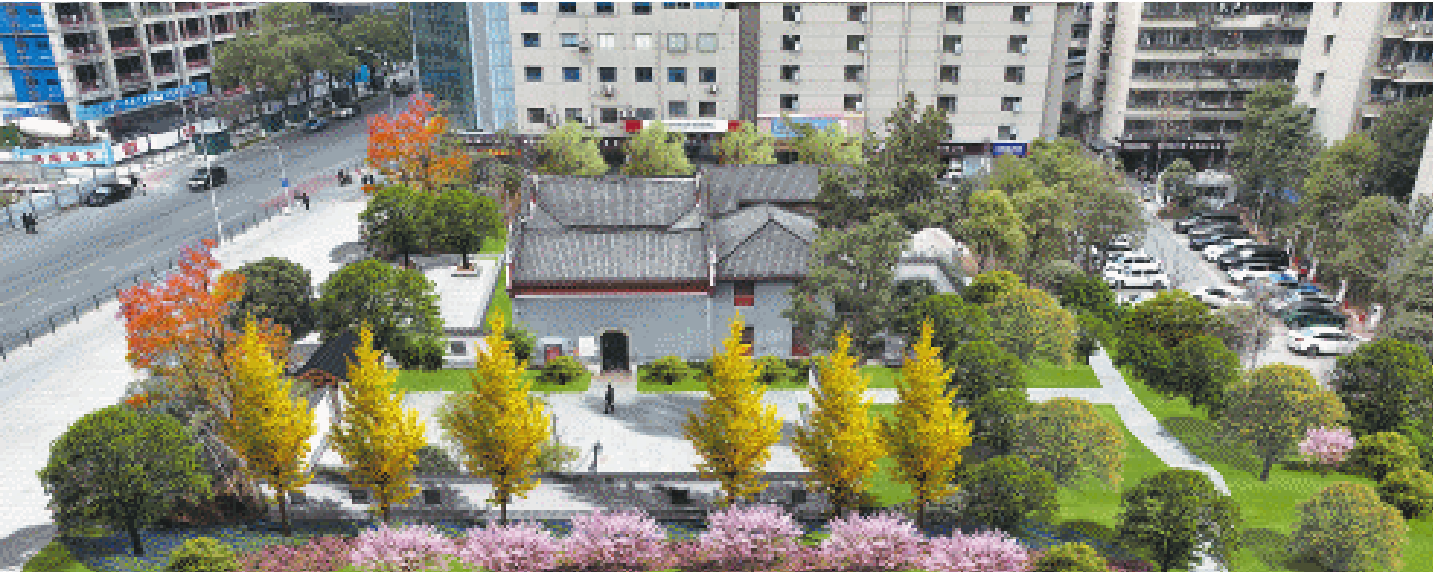
旧址完工后的效果图。