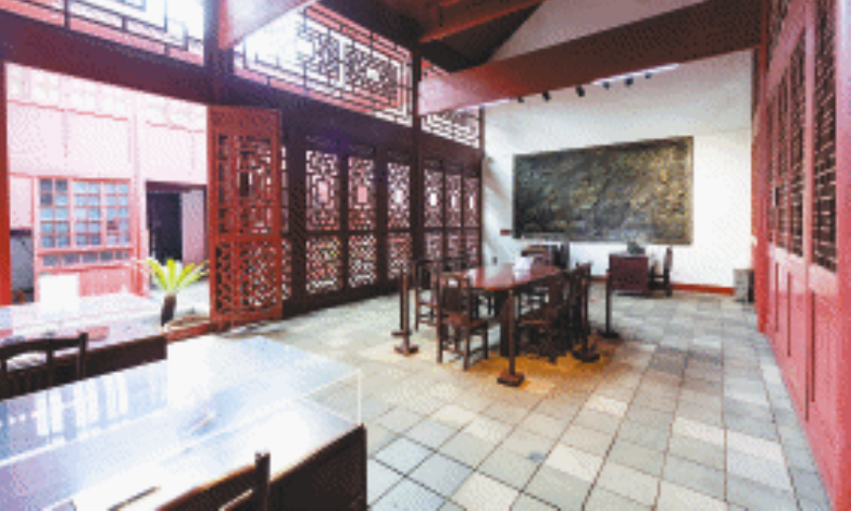
八路军驻湘通讯处旧址。

春回大地万物苏,植树添绿正当时。28日,长沙市文旅广电局、芙蓉区文旅体局、芙蓉区园林中心组织开展八路军驻湘通讯处旧址义务植树活动。同时,记者在活动中获悉,旧址及周边正在进行文物本体修缮和环境整治工程,建设抗战主题文化广场。工程完工后,旧址还将提升展陈功能,最终打造成为具有纪念馆教育功能和公共文化及旅游经济发展功能的“长沙红”文化新地标。