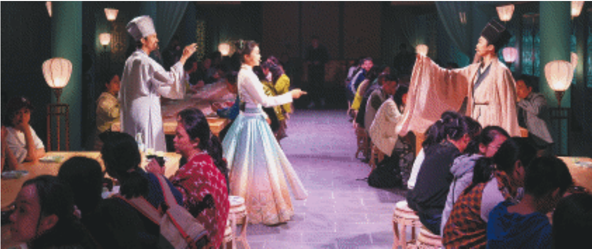
橘子洲江天暮雪文化园为游客带来一场沉浸式的宋式美学极致体验。