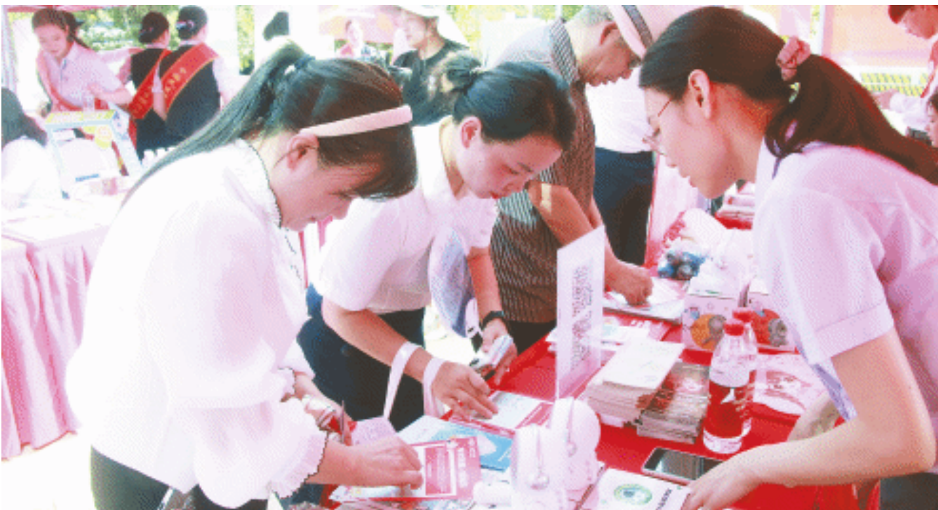
在国家金融监督管理总局湖南监管局的部署下,长沙银行开展2024年“金融教育宣传月”户外宣传活动,向消费者普及金融知识。

在2024年“金融教育宣传月”期间,长沙银行的宣传活动也取得了显著成效。该行向手机银行客户推送9月活动主题海报,触达消费者24万人次,在长沙地铁6号线投放“金融消费者八项权益漫画解读”宣传内容,打造金融知识专列,月均客流量约70万人次。