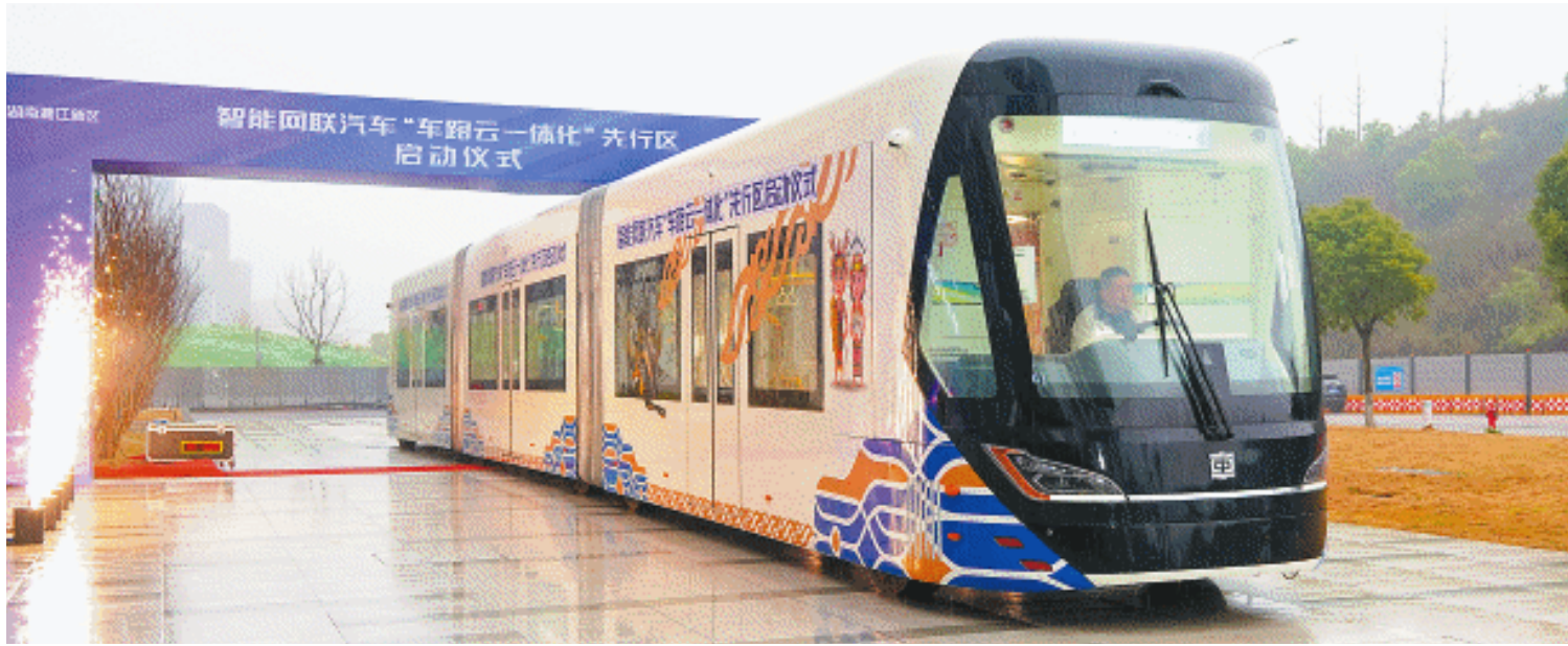
3月13日，智能网联汽车“车路云一体化”先行区启动仪式在湘江智能网联产业园举行。

长沙晚报3月14日讯（全媒体记者 李金 通讯员 柯鸣 彭欣婧）推进“车路云一体化”试点，长沙又有新动作！3月13日，智能网联汽车“车路云一体化”先行区启动仪式在湘江智能网联产业园举行。该先行区以岳麓高新区为核心，通过全域开放测试、基建升级、场景创新等举措，推动车、路、云深度融合，标志着长沙智能网联汽车产业迈入规模化示范应用新阶段。