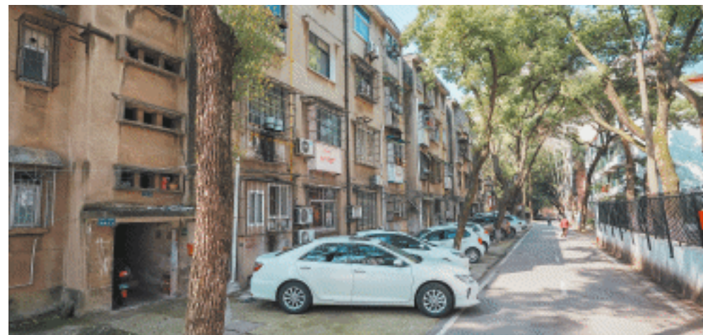
随着水改启动,轻工设计院小区居民将告别用水难。

深受用水问题困扰的居民,多次向上级部门反映情况,然而因各种历史原因小区未完成“三供一业”移交,水改工作迟迟无法推进。去年,井湾子街道及井湾子社区多次向长沙市供水公司及雨花区住建局等单位对接,表达水改的强烈需求。