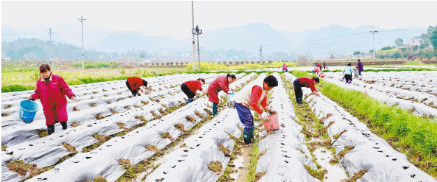
在宁乡大成桥镇成功塘村香芋种植基地,村民正在抢农时种芋苗。

“目前成功塘村香芋基地共有220亩,大成桥全镇种植香芋超过了2200亩。”说起香芋产业,大成桥镇农办主任周小林如数家珍。他告诉记者,惊蛰节气之后,便是种植香芋的最佳时机,1亩田大约下种1800个至1900个芋苗,到9月丰收时,