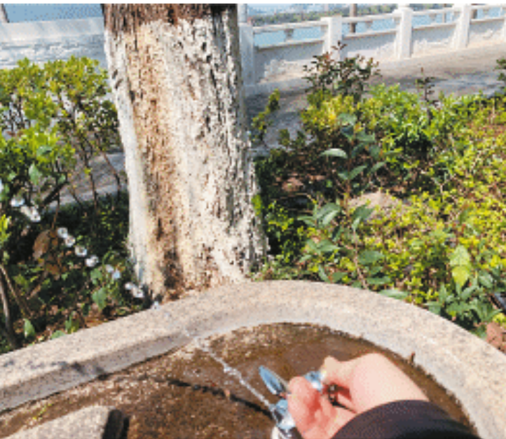
风光带上的直饮水泵可以正常使用了。