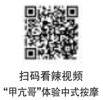
扫码看辣视频 “甲亢哥”体验中式按摩