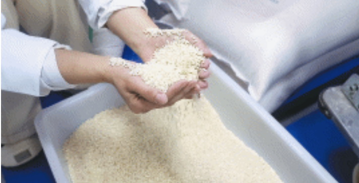
用于生产米粉的早籼米品种。

实现一粒稻谷到一袋米粉“生产+加工+销售”全产业链发展，白箬铺走出了自己的路子。