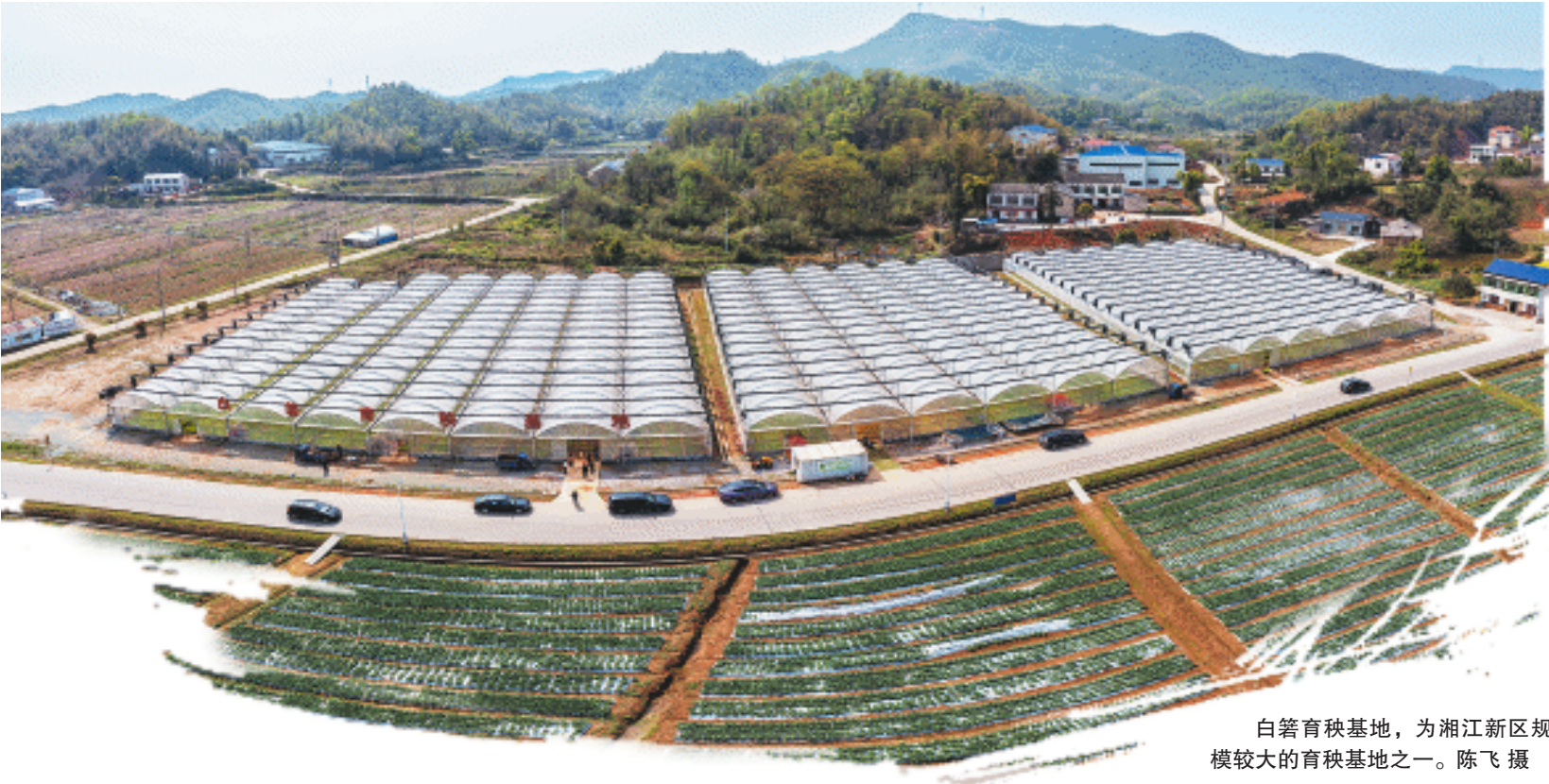
白箬育秧基地，为湘江新区规模较大的育秧基地之一。