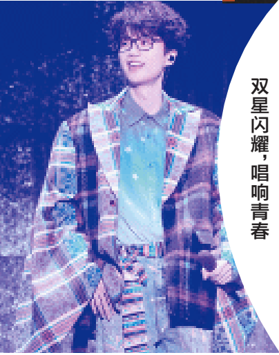
许嵩演唱会上，《雅俗共赏》《奇谈》等耳熟能详的金曲响彻夜空。

其实早在4月12日晚，长沙就已沉浸在音乐的狂欢之中。许嵩与周华健两位音乐“大咖”同时在长沙贺龙体育中心与湖南国际会展中心开唱。数据显示，当晚有3.7万余人倾听许嵩，周华健演唱会8000个座位也座无虚席。两场演唱会吸引5万左右歌迷，当烟火长沙遇上音乐盛宴，长沙文旅又迎来了一波热潮。13日，周华健再唱一场，延续热度。