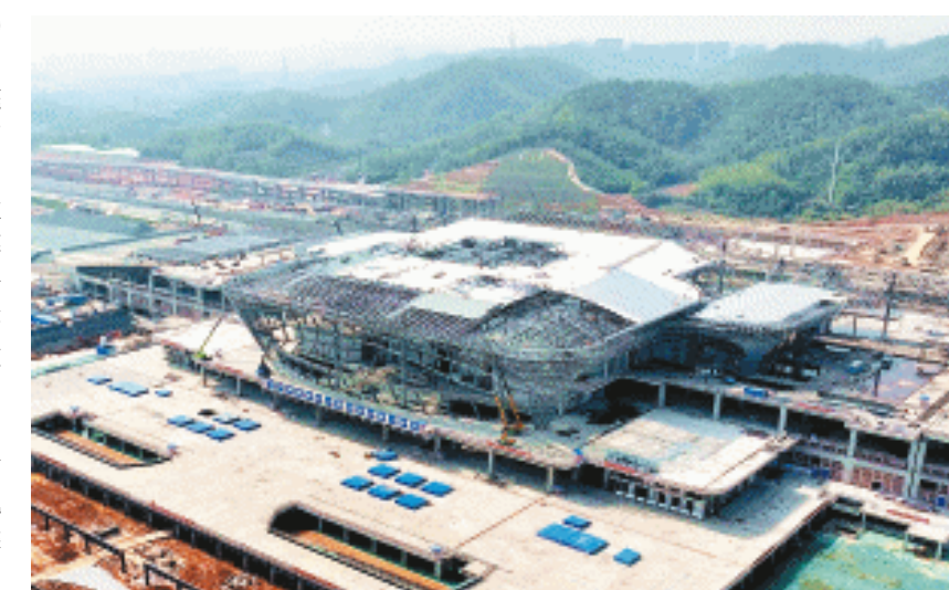
长沙高铁西站多个区域施工完成率达100%。

长沙晚报4月15日讯（全媒体记者 彭放）暮春时节，长沙高铁西站项目建设正酣。目前，站房建设进度已经过半，多个区域施工完成率达100%，一座以“三湘四水、杜鹃花开”为设计理念的现代化高铁枢纽正加速崛起。 15日，记者在项目建设现场看到，作业人员正在高空作业车上进行金属屋面和幕墙龙骨施工，现场一派热火朝天的施工景象。从高空俯瞰，长沙高铁西站站房呈十字形布局，建筑造型宛若一朵花瓣错落有致的杜鹃花，展现出独特的湖湘韵味。 据悉，长沙高铁西站设计为地上四层，地下两层。其中，地下两层分别为长沙西站地铁2/12号线与10/S2号线地铁站台层；地面一层为旅客换乘大厅层，设置了地铁换乘站厅、公交、长途客运、社会停车场；二层为铁路旅客出站平台层， —— 下转2版4