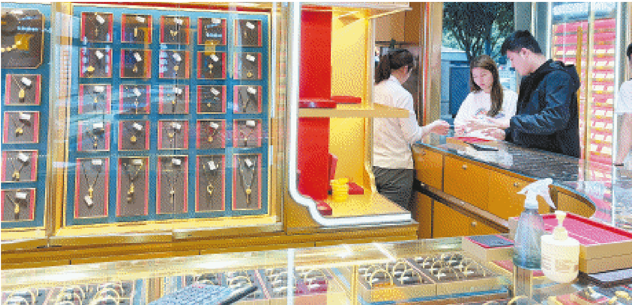
消费者在线下购买黄金首饰。

专业人士分析指出,黄金价格上涨主要是受到全球央行持续增加黄金储备,以及全球地缘政治局势紧张等因素的影响。中信建投期货贵金属分析师王彦青认为,驱动金价上涨的核心逻辑在于,美国关税政策正阻碍全球分工的供应链体系,同时破坏了以美元为中心的货币体系。当人们使用美元会承担更多成本时,市场对美元的信心度及需求就会降低。考虑到黄金仍