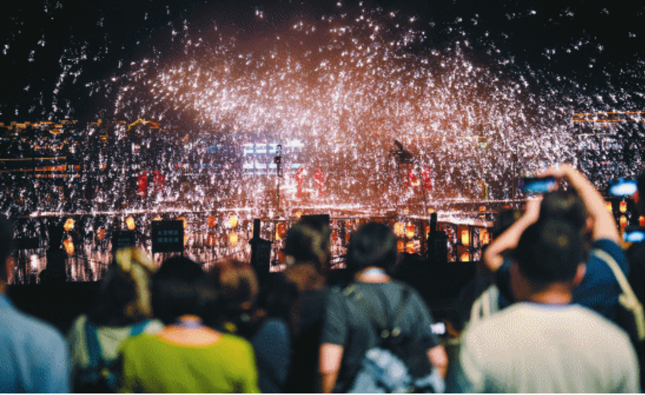
五一假期即将来临，长沙成为热门旅游目的地之一。这是4月19日游客在铜官窑景区观看打铁花。