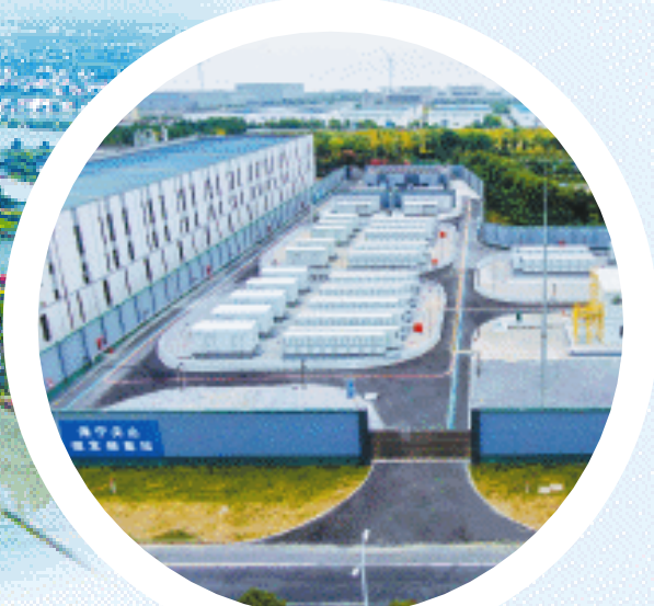
在海宁尖山新区,企业屋顶安装光伏发电板已成为“标配”。图为海宁尖山恒发储能电站。

短短几年,徐家埭村集体经济总收益从不到200万元增长到1500万元,不仅自身蝶变跃升为美名远扬的“中国棒球第一村”,而且为江南水乡