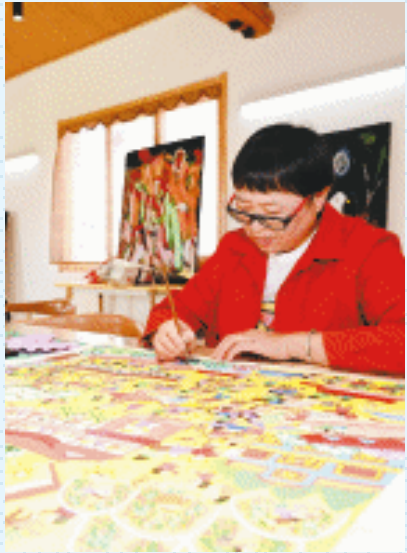
胜丰村是浙江省级非物质文化遗产代表性项目“秀洲农民画”的发源地之一。图为村民正在创作农民画。