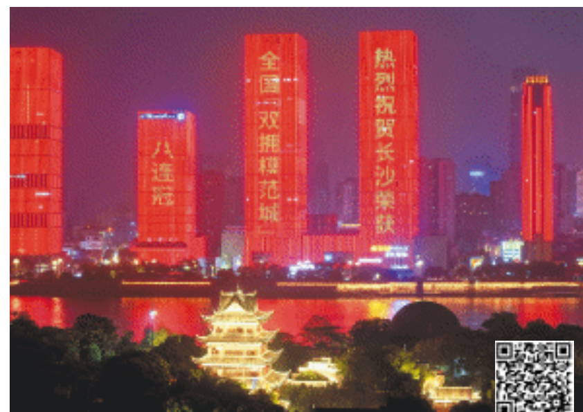
23日晚，湘江两岸楼宇一一点亮，以一场绚丽的灯光秀庆祝长沙荣获“全国双拥模范城”八连冠。

● 长沙晚报全媒体记者 凌晴 祝林灿 星城大地，双拥花开。 这个春日，长沙这个红色热土、革命摇篮，又一次迎来高光时刻——在23日召开的全国双拥模范城（县）命名大会上，长沙市获得“全国双拥模范城”称号，这也是从1997年至今，连续第8次获此殊荣。