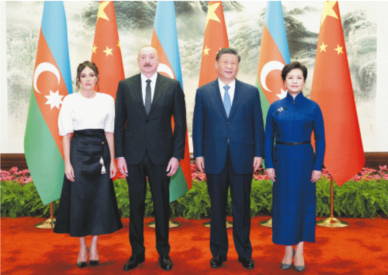
4月23日上午，国家主席习近平在北京人民大会堂同来华进行国事访问的阿塞拜疆总统阿利耶夫举行会谈。这是习近平和夫人彭丽媛同阿利耶夫和夫人阿利耶娃合影。