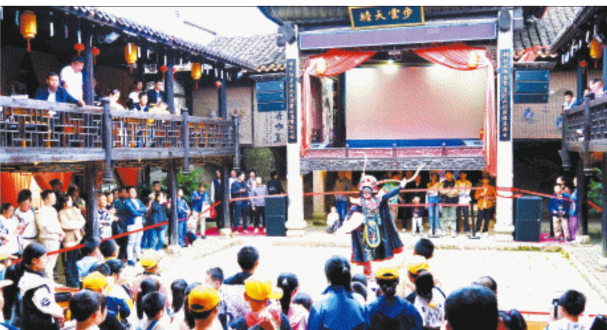
靖港古镇八元堂内好戏连台。

目前靖港古镇推出了多种优惠套票,游客朋友可以通过靖港古镇小程序、抖音、美团等平台了解。另外,5月,“靖港·青春背包客”线上招募计划、公众号《靖港青年创客日记》专栏、“花开靖港 游我体验”全民UGC共创计划、“我在靖港看大戏逛大集”短视频挑战赛都将全面上线,福利送不停,邀您来参与。