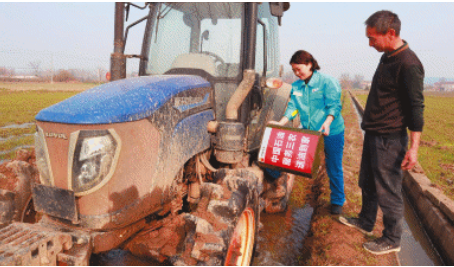
中国石油湖南销售公司积极开展乡村振兴帮扶。