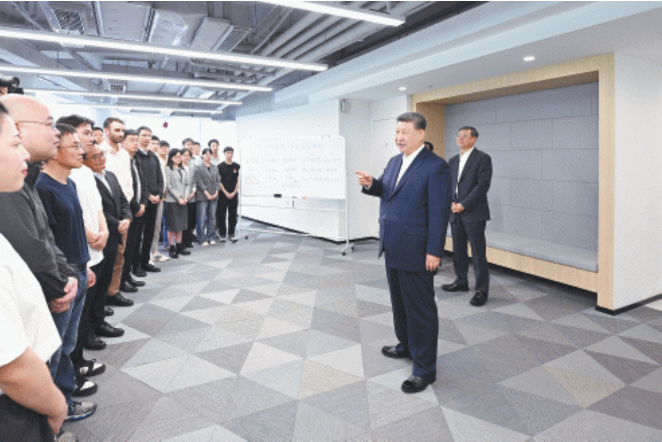
4月29日,中共中央总书记、国家主席、中央军委主席习近平在上海考察。这是习近平在位于徐汇区的上海“模速空间”大模型创新生态社区,同正在参加“下一代智能体的自主进化”主题沙龙的青年创新人才亲切交流。

新华社上海4月29日电 中共中央总书记、国家主席、中央军委主席习近平29日在上海考察时强调,上海承担着建设国际科技创新中心的历史使命,要抢抓机遇,以服务国家战略为牵引,不断增强科技创新策源功能和高端产业引领功能,加快建成具有全球影响力的科