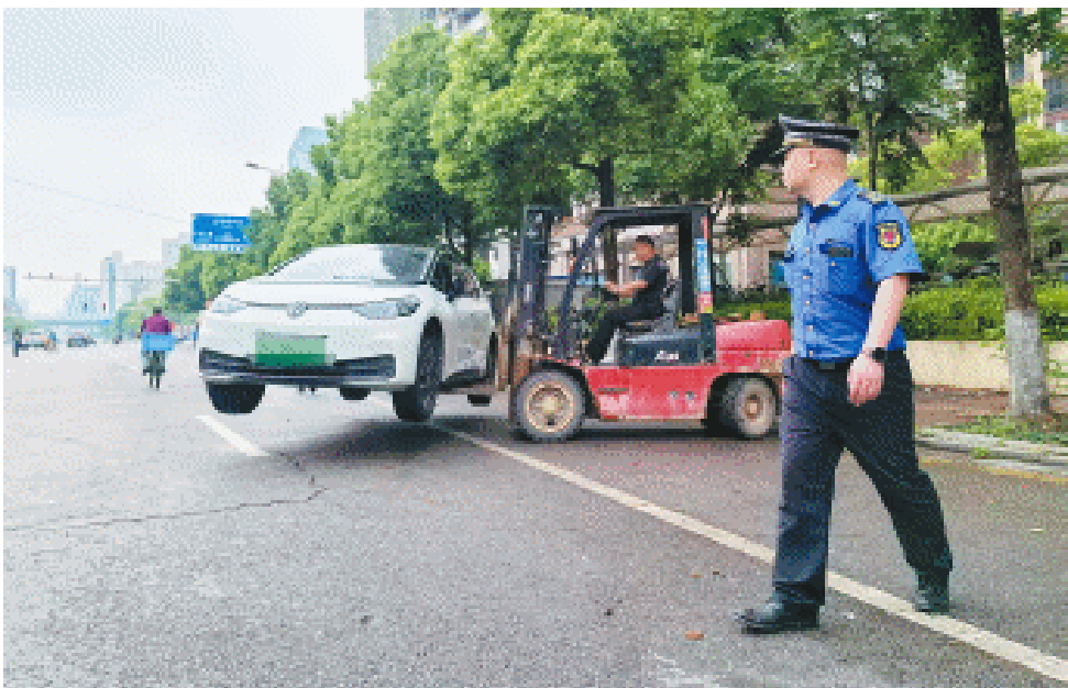
截至上午10时累计劝离车辆100多台,叉车转移9台。

砂子塘新世界小学分管安全副校长胡怡梅介绍,该校国欣向荣府和旭辉国悦府片区学生均需途经此路段,此前虽多次开展安全教育并向街道申请整治,但违停问题反复,安全隐患始终未彻底消除。