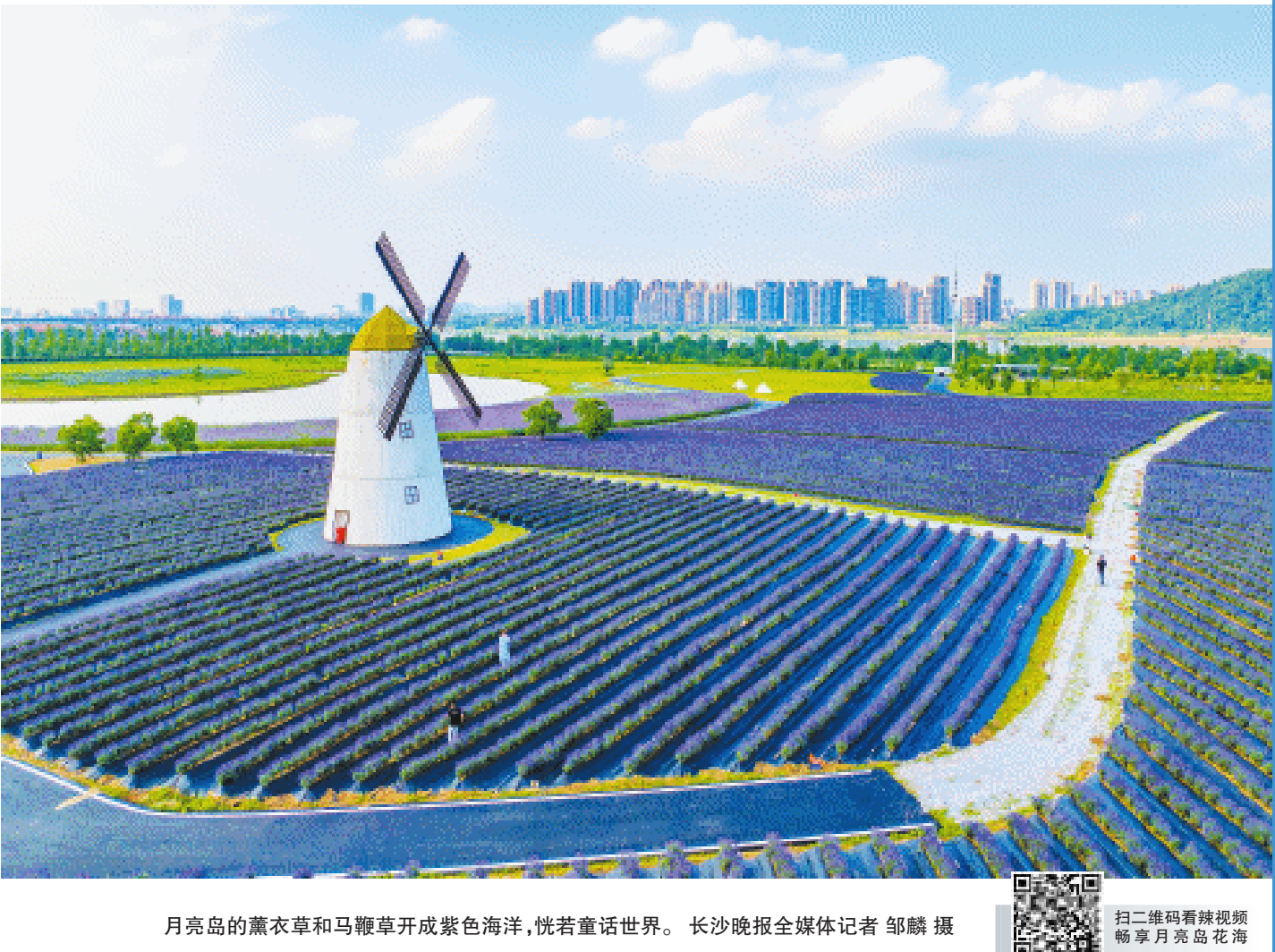
月亮岛的薰衣草和马鞭草开成紫色海洋，恍若童话世界。

长沙晚报5月18日讯（全媒体记者 贾凯清）在湘江的悠悠碧波之上，月亮岛宛如一颗江心明珠，一直以来都是长沙市民踏青休闲的好去处。18日，记者从长沙城发集团获悉，月亮岛即将于5月20日焕新回归。阔别两年半之久，它将以全新姿态重回大众视野。 月亮岛位于长沙北翼、湘江中段江心，总面积为2.62平方公里，是湘江流域中最大的江心洲岛。月亮岛以“生态休闲体育岛”为定位，凭借独特的自然禀赋和功能布局，是中国网球巡回赛等系列赛事举办地、市民游客休闲娱乐的热门地。 本次回归后，公园内将新增许多打卡点，原有的场地和设施也将实现升级。在运动场地方面，岛上的“红土网球公园”备受瞩目。该公园是法网同款红土网球场，享有顶级配置。2024年4月，“网球女王”郑钦文曾在这里参加比赛，未来还将迎来诸多国内顶级网球赛事。此外，还有全新足球公园、室外篮球场即将开放，等待市民前来体验。 在文旅设施方面，月亮岛新增由城发文旅和长沙宜家携手打造的“橘室·月亮宿集”，涵盖营地、休闲娱乐、房车等，构建户外休闲度假综合体，市民游客可通过线上预约前往体验。超6万平方米的超大花海也是本次开园的“重头戏”，薰衣草、马鞭草正值花期，如同一幅油画，是浪漫打卡胜地。公园内还有无动力乐园、观光游览车等配套设施，极大地提升市民游客的体验感。 记者了解到，焕新升级的月亮岛开放时间为每天9时至22时，市民游客步行上岛无需预约，车辆上岛则需要凭“长沙月亮岛”官方微信公众号进行预约。岛上共设有南部、中部、北部、桥下四大停车场，合计公共停车位约2200个。