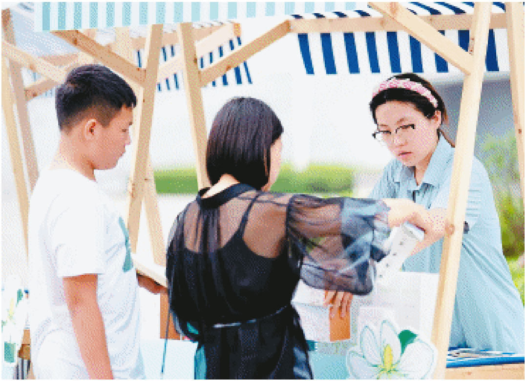
市民领取楫香礼物。

「非遗扎染」遇上「栀子飞花令」 2025年栀子花文化旅游主题推广活动启动发布13条文旅线路,