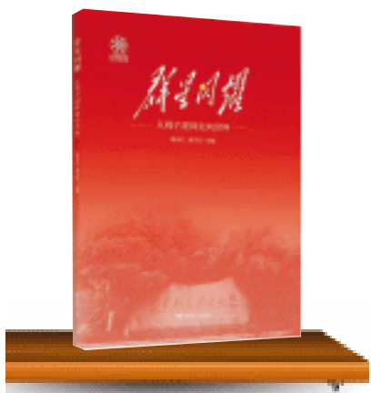
《群星闪耀——从桃子湖畔走向世界》谢永红 黄月初 主编/湖南教育出版社/2025年4月

2024年1月31日,湖南省委、省政府在长沙正式启动“校友回湘”活动,号召发挥校友的力量,助力湖南实现“三高四新”美好蓝图。2025年,湖南师范大学附属中学(以下简称“附中”)迎来120周年校庆。这所坐落于岳麓山下、桃子湖畔的百年名校,为国家孕育了一代又一代栋梁之材。在长沙晚报社和校友会的积极推动下,一场名为“校友回湘”的寻访活动由此展开,通过记录校友与母校之间跨越岁月与山河的情谊,展现附中教育的深远影响。这不仅是对历史的致敬,更是对未来的期许。《群星闪耀——从桃子湖畔走向世界》(由长沙晚报社策划采写、湖南教育出版社2025年版,谢永红、黄月初主编)正是对这场寻访活动的真实记录,从中我们得以窥见湖南基础教育的传承与创新,以及她为时代发展注入的源源不断的活力。