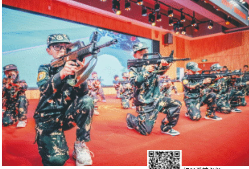
一中附小学生进行战术表演。

由一中附小19名学生组成的战术表演方阵迈着整齐的步伐登场，随着教练的口令“立姿据枪、卧姿据枪……”，孩子们腾挪闪劈虎虎生风，惊起现场一片叫好声。军区社区党委书记周紫微接过芙蓉区文武部颁发的“戎装少年推介官”奖牌，并发布2025年“戎装少年”国防教育品牌三大升级计划。 韭菜园街道军区社区位于长沙市中心城区，辖区内军地机关、企事业单位云集，“五老”队伍庞大，资源丰富。2019年，军区社区升级打造“戎装少年”项目，着力推进教育融合、军地协同、科技赋能，让青少年国防教育紧跟时代步伐，更具感染力，有效提升青少年国防素养。截至目前，该项目累计服务青少年超5000人次。街道负责人表示，2025年，“戎装少年”将锚定“国防教育+文旅融合”新定位，持续深化“军地共建”模式，推动国防教育从课堂走向社会，让红色薪火代代相传，强军梦想永不熄灭。