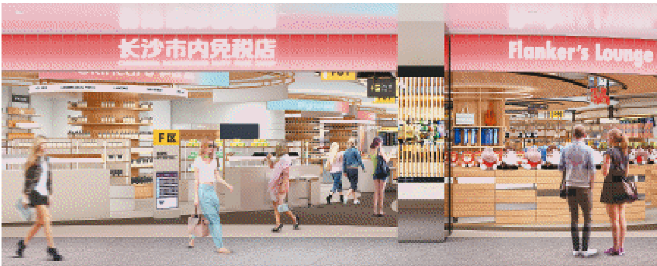
长沙市内免税店设计效果图。

据悉，长沙将以市内免税店为载体，深化内外贸全链条协同发展，搭建常态化产销对接平台，推动“长沙制造”走向全球市场，实现进口商品“零时差”上新，构建“买全球、卖全球”的开放型商业生态圈。天心区将以此为契机，加快培育国际消费新趋势，孵化有潜力的出海品牌，推动国潮文化发展。