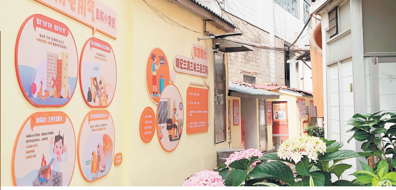
江家巷提质改造后蝶变转身。