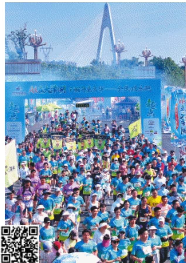
5月30日上午,Ai在大泽湖·端午嘉年华——全民欢乐跑在大泽湖近自然湿地公园热力开跑。

近年来,随着香炉洲大桥等53个配套项目陆续落地,这片曾经的城郊湿地已蜕变为全新的“生态会客厅”。当前,香炉洲大桥长虹卧波,兴联路大桥顺利通车,地铁4号线北延施工如火如荼,潇湘北路快速化改造等加速推进;大泽湖海归小镇、湘商总部基地研发中心启动运营;湖南第一师范学院大泽湖学校、长沙市一中大泽湖学校、湖南师范大学附属中学大泽湖校区等学校纷纷入驻;浅层地热能开发利用项目让6.7平方公里区域低碳实现“冬暖夏凉”,长沙市四医院滨水新城院区、工人文化宫、滨江公园等配套设施先后建成,正不断提升片区居民的生活品质。