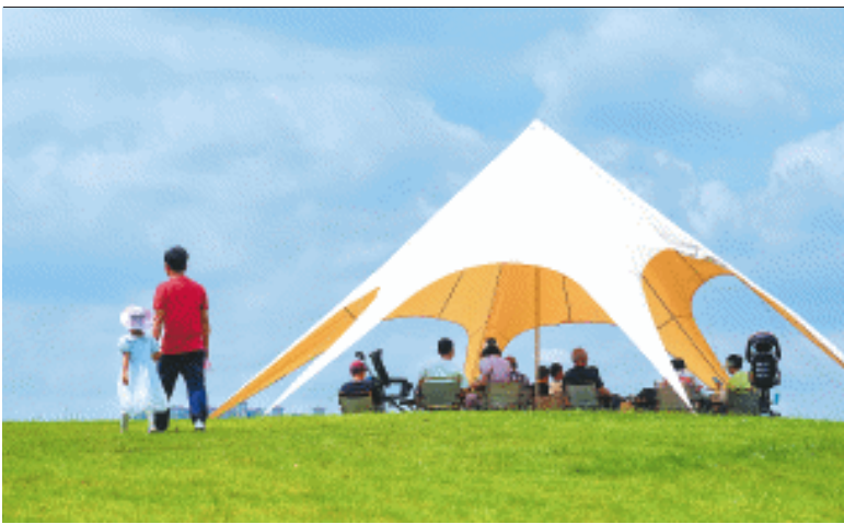
大泽湖近自然湿地公园“五乐园”包括儿童乐园、体育乐园、拓展乐园、研学乐园、萌宠乐园,足足2.6万平方米的区域成为星城遛娃热门打卡地。

长沙晚报5月30日讯(全媒体记者 朱华 通讯员 叶思佳)5月30日8时48分,Ai在大泽湖·端午嘉年华——全民欢乐跑在大泽湖近自然湿地公园热力开跑,来自全国各地的1000名跑友化身首批“生态探索者”,奔跑在全新开放的“城市绿肺”,和当地群众共同见证这座生态新地标的惊艳亮相,感受融合生态、运动与科技的文体狂欢的魅力。