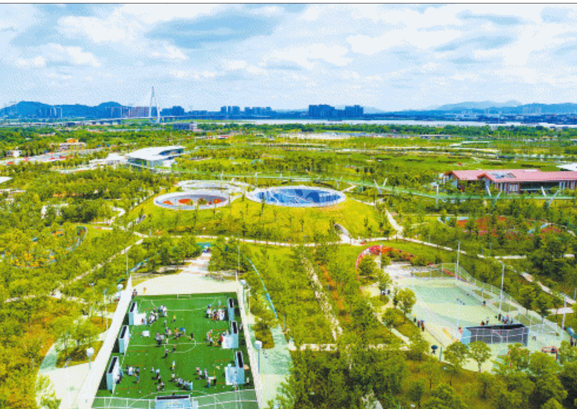
5月30日,大泽湖近自然湿地公园正式开园。