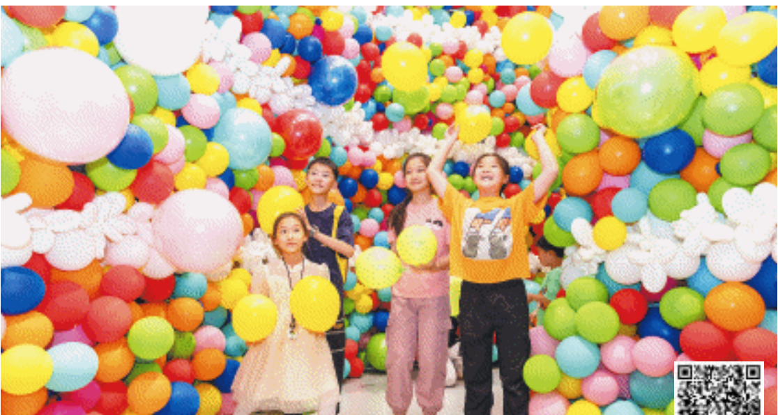
6月1日，端午假期遇上儿童节，梅溪湖艺术博物馆开启“一秒回到童年”体验活动，下午3时，博物馆中庭上空的巨型透明袋缓缓打开，成百上千颗五彩气球如流星雨般倾泻而下，孩子们在“梦幻气球雨”中穿梭打闹。