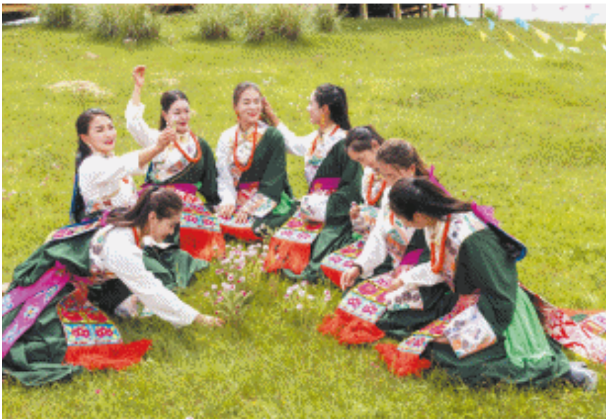
位于西宁市湟中区多巴镇扎麻隆村的凤凰山，属于东昆仑山余脉，山势犹如一只展翅欲飞的凤凰，人称“九龙朝凤”圣地。图为身着民族服饰的姑娘们在凤凰山营地摘花游戏。

↑直亥天池，也叫直亥雍措（碧玉般的湖），位于青海省海南州贵南县海拔4500米以上的直亥村，核心区有雪峰、溪水、草地、山花等优美自然景观，宛如仙境。