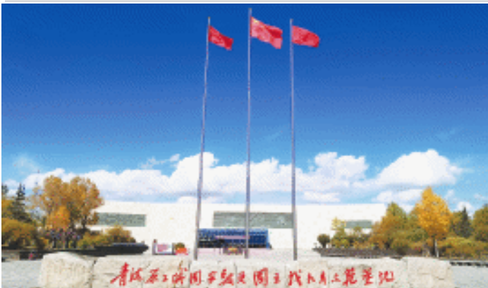
位于海北州西海镇的青海原子城国家级爱国主义教育示范基地。