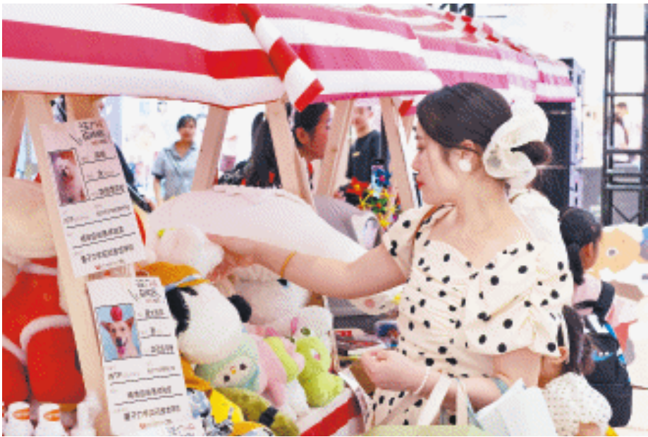
长沙市各动物保护组织联合举办的爱心义卖活动现场,市民驻足观看。