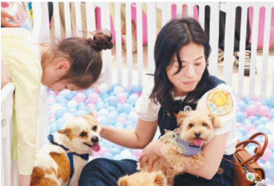
动物保护人士和他们救助的流浪狗。

初夏伊始,警钟敲响。近日,湖南省疾控中心发布我省今年6月疾病风险综合预报及防疫指数,指出需要重点关注犬伤。 就在上个月,全省各地出现多起犬只伤人事件:5月8日,安化县梅城镇一犬只咬伤多人;5月12日,醴陵一小女孩在外玩耍时被狗扑咬受伤,据称该狗在村里咬伤多人…… 犬伤事件频发背后隐藏的风险不容忽视。近年来,随着养宠人群增加,由于遗弃、走失及无节制自然繁衍等产生的流浪动物数量也在不断上涨。流浪狗在居民小区、繁华街道等地的随意活动,给城市治理带来了不容忽视的危害:一方面,流浪狗影响城市的环境卫生和公共秩序;另一方面,它们可能携带各种疾病,对居民健康构成潜在威胁。尤其值得警惕的是,恶性流浪狗咬人事件时有发生,天气炎热的夏天,长沙市区犬伤门诊市民被狗咬伤的案例都会明显增多。5月30日,记者从长沙市公安局治安支队独家获悉,全市过去两年每年有6万多人次被狗咬伤或挠伤。 长沙街头时有出现的流浪狗从哪里来?它们将被送到哪里去?当市民在公共场所遇到流浪狗时最好的处理方式是什么?目前长沙对于流浪狗的综合处理和长效管理,又存在哪些亟待破解的难点与瓶颈?连日来,长沙晚报记者深入街头巷尾,走访相关部门,进行了采访调查。