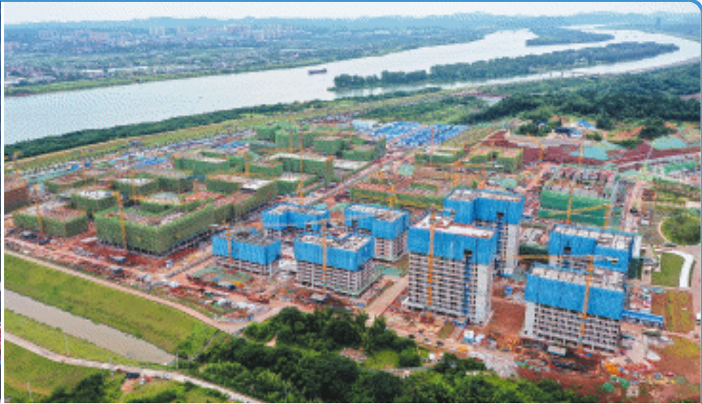
6月20日，湖南大学科创港校区建设（一标段）项目迎来首批楼栋主体结构封顶。

长沙晚报6月20日讯（全媒体记者 邓艳红 通讯员 杨彬翰）6月19日，竖店影视基地全面施工仪式在望城铜官窑国风乐园举行。这座集短剧拍摄、影视人才培养、产业服务于一体的全链条基地正式迈入建设快车道，将为中部影视产业发展注入强劲动力。 据了解，整个建设工程预计在9月30日前完成近2000万元投入，届时将有约1000名学生入驻，成为重要的影视人才培养基地。此外，基地从今年国庆节起将逐步对外开放，承接剧组进入拍摄。 此次建设项目亮点十足，涵盖学生片场、宿舍、教室、食堂等核心项目；片场规划了候机厅、地铁内景