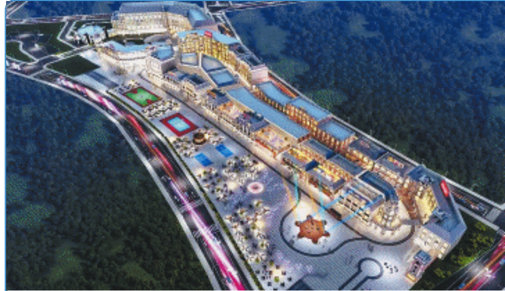
竖店影视基地效果图