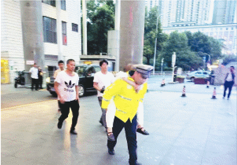
天心交警背着患者前往医院就诊。长沙晚报通讯员 吴莎 供图

在拥堵的车流中硬生生开辟出一条畅通无阻的“绿色生命通道”。 警车引领,绿波保障,救援车队在晚高峰的车流中疾驰而过。原本在晚高峰时段至少需要30分钟的路程,在交警争分夺秒的护送下,仅用时6分钟便安全抵达湖南省人民医院。下车后,交警背着患者快步奔往医院。这场与时间的赛跑,为危重患者赢得了极其宝贵的黄金抢救时间,患者被迅速送入急诊室接受治疗。 “当时路上堵得根本动不了,我们急得不行。看到交警同志过来,心就定了一半。没想到这么快就到了医院,真的太感谢了!”求助群众对天心交警的果断处置和高效救援表达了深深的感激。 长沙交警提醒,市民群众如遇紧急送医等突发状况,在确保安全的前提下,可第一时间拨打122或向路面执勤交警求助。长沙交警将持续优化急救救援联动机制,竭力保障市民生命通道畅通无阻。