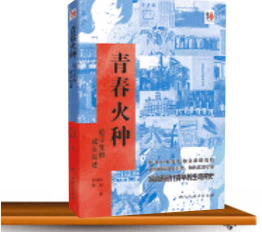
《青春火种：追寻党的成长足迹》/张神根、张偲 著/广西人民出版社/2025年4月

青年是祖国的栋梁，是各项事业的中坚力量。为增进广大青年的党性教育，中央党史和文献研究院专家张神根、张偲的新著《青春火种：追寻党的成长足迹》描摹了从1915年陈独秀创办《新青年》，到兴起新文化运动，再到1921年7月中国共产党成立的风云历史。在回眸党的来时路时，进一步讲清了“历史和人民为什么要选择中国共产党”这一根本命题。