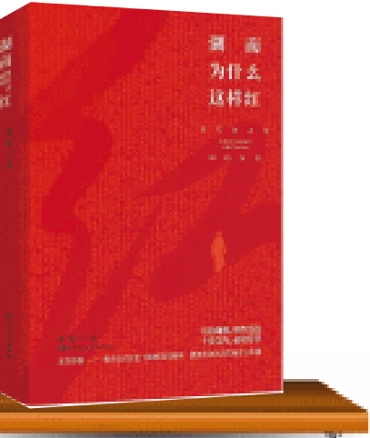
《湖南为什么这样红》/罗宏著/湖南人民出版社/2025年6月

展开“湖南为什么这样红”的宏阔画卷，为我们了解红色历史、亲近英雄、传承基因，开启了一把明史增智的闪光之匙。