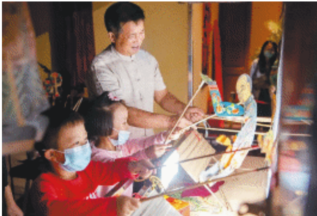
在长沙非遗馆开展的皮影戏传习体验活动。