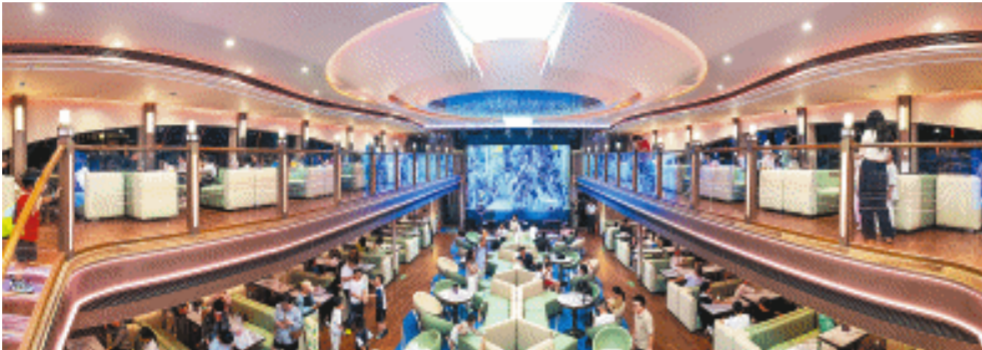
“橘洲号”共有三层，一层及二层为室内区域，三层甲板则是露天区域。

“橘洲号”共有三层，一层及二层为室内区域，三层甲板则是露天区域，市民及游客可在此“全景式”观赏星城景色。游轮从三馆一厅旅游码头出发，一路游览金融中心、渔人码头、裕湘纱厂、万达广场、杜甫江阁、橘子洲头六个景点，最终回到三馆一厅码头，一次全程游览的