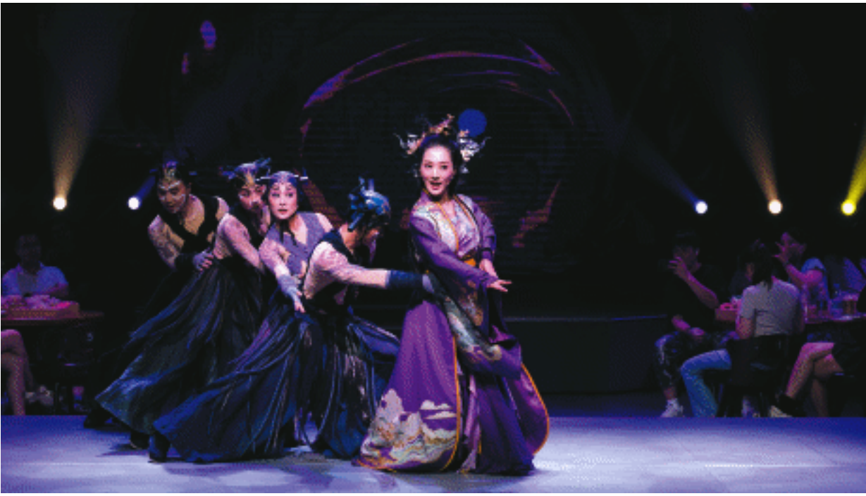
7月4日晚,历经10个月的打磨升级,《聂小倩》2.0版在长沙市天心区坡子街湘江剧场首演。图为《聂小倩》2.0版剧照。

譬如演员在剧场内玩起了“室内蹦极”,舞台延伸至观众席,观众成为“群演”。观众席A区提供火宫殿同款长沙小吃,B区主打怀旧旧六官格零食,让大家在湘剧韵味中品味烟火气。