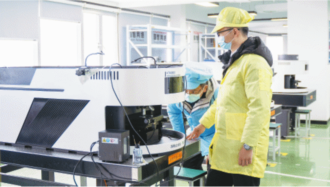
奥谱天成(湖南)信息科技有限公司生产车间里的产品。

政府服务部门的一对一服务，更打通了科创企业成长路上的堵点；未来有望申报湖南省“首台套”重大技术装备补贴，充分彰显了政府对创新企业高质量发展的高度重视和积极鼓励。