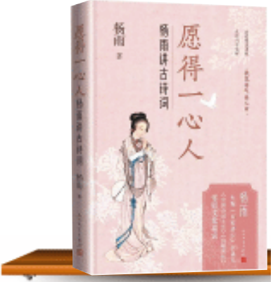
《愿得一心人: 杨雨讲古诗词》/杨雨 著/人民文学出版社/2025年4月