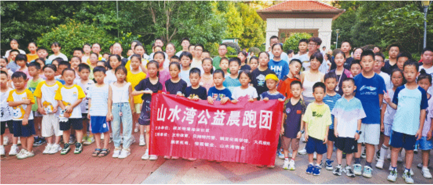
晨跑活动吸引百余名少年儿童参加。

长沙晚报7月9日讯(全媒体记者 周小华 实习生 向思强)“加油!加油!”“别放弃,只有一圈了!”9日清晨6时多,长沙县湘龙街道湘滨社区山水湾小区热闹非凡,“加油”声此起彼伏,百余名少年儿童在暑假近开矫健步伐,跟着“山水湾公益晨跑团”热力奔跑。