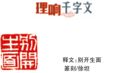
释文:别开生面 篆刻/徐坦