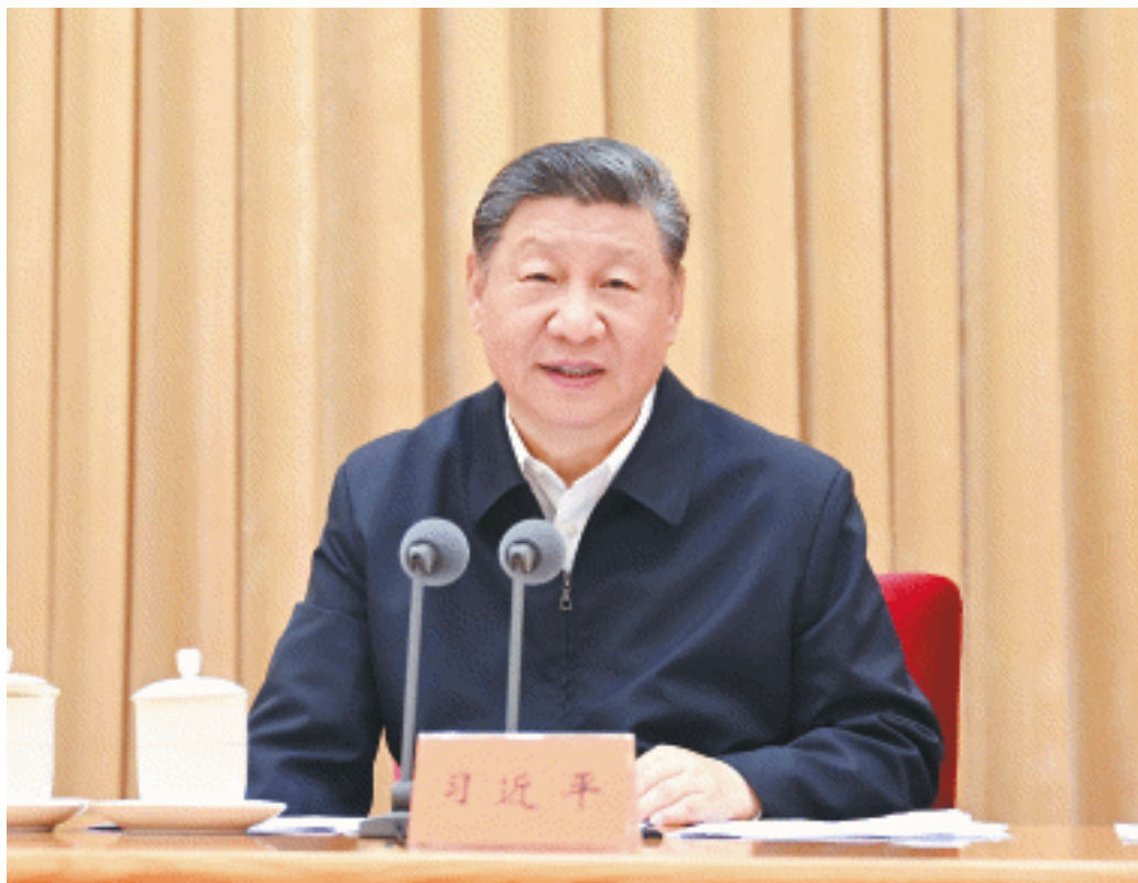
7月14日至15日，中央城市工作会议在北京举行。中共中央总书记、国家主席、中央军委主席习近平出席会议并发表重要讲话。

新华社北京7月15日电 中央城市工作会议7月14日至15日在北京举行。中共中央总书记、国家主席、中央军委主席习近平出席会议并发表重要讲话。中共中央政治局常委李强、赵乐际、王沪宁、蔡奇、丁薛祥、李希出席会议。